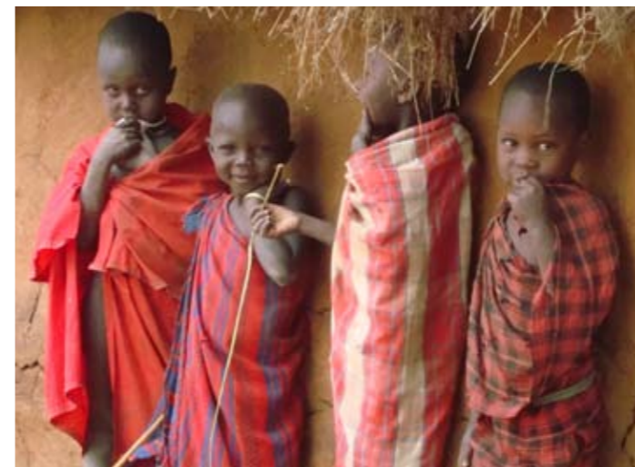
Masai-kinderen uit Tanzania.