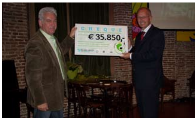
Tijdens Concert Culinair Enkhuizen van DO West-Friesland (voorheen African Aid Connection) in de zomer van 2008, werd veel geld ingezameld voor het werk van Dorcas.