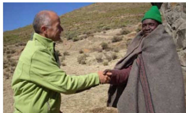
Ontmoeting met een 'granny' tijdens een ondernemersreis naar Lesotho, juli 2008.