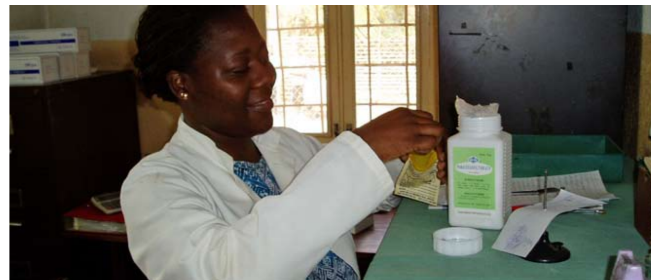
Dorcas financiert een medische kliniek in de havenstad Beira, Mozambique.

Wau is een arme stad in Zuid-Soedan waar ongeveer honderd-duizend mensen leven. Tijdens de oorlog zijn veel mannen uit de stad gesneuveld. Vrouwen, kinderen en ouders bleven achter. Zij hebben moeite om in eigen levensonderhoud te voorzien. Een groot aantal jonge mensen in deze regio is werkloos en/of heeft geen opleiding gevolgd.