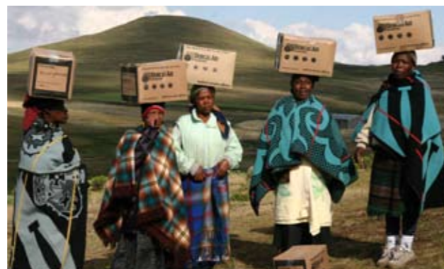
Hulpgoederen die Dorcas van bedrijven ontvangt vinden een nieuwe bestemming.

diverse goederen ingezameld. Een overzicht van de nodige artikelen staat op onze website: www.dorcasenbedrijven.nl/hulpgoederen met daarop onder meer kantoormeubilair en -artikelen, witgoed, bedtextiel en producten voor persoonlijke verzorging. Heeft u goederen die niet op de lijst voorkomen, maar wel goed bruikbaar zijn voor hulpverlening, neemt u ook dan contact op.