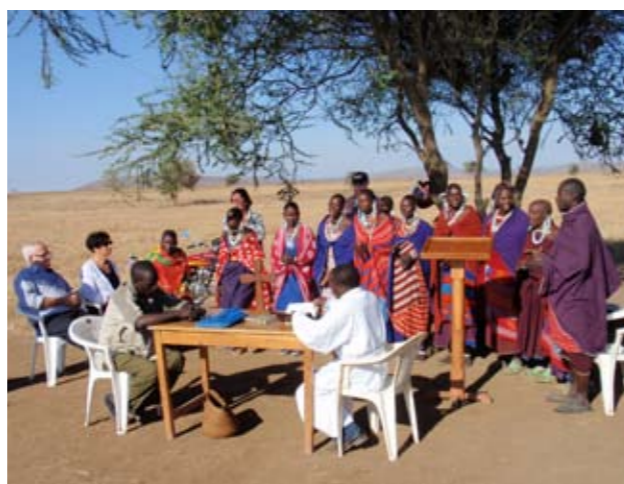
Een bezoek aan een kerkdienst bij de Masai in Tanzania.

'Op zondagmorgen moest ons reisgezelschap al vroeg uit de veren om een kerkdienst van Masai in Tanzania te kunnen bijwonen. De viering vond in de open lucht plaats. Net voordat wij arriveerden, was de voorganger op zijn bromfietst aangekomen. Terwijl kerkbezoekers druk waren met het klaarzetten van banken en een tafel, kwamen van alle kanten Masai aanlopen. Sommigen met hun kudde. De dieren bleven in de buurt rondscharrelen, terwijl de herders de viering bezochten. Het meemaken van zo'n kerkdienst is een ervaring om nooit te vergeten. Na afloop hebben we gezongen en gedanst met de kinderen.