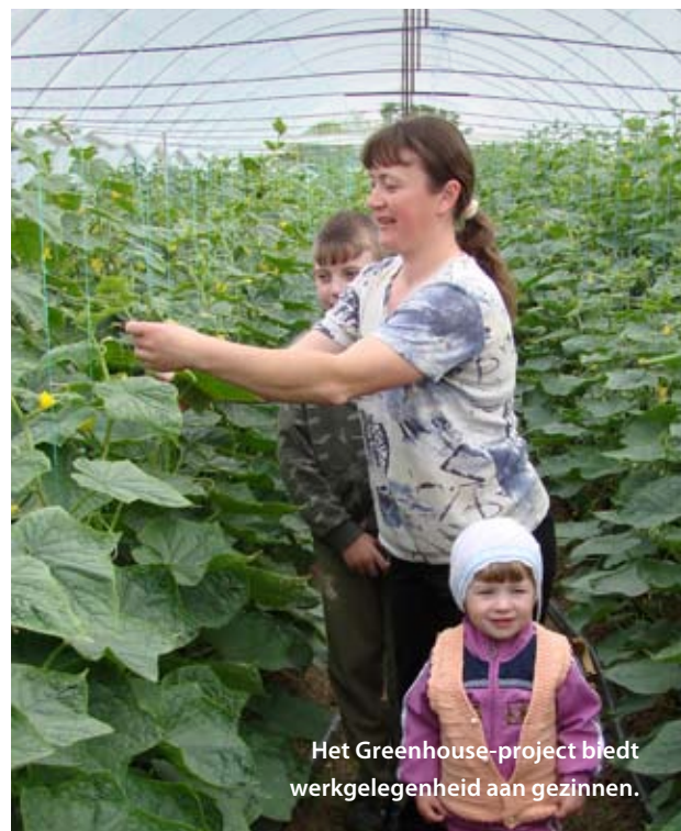
Het Greenhouse-project biedt werkgelegenheid aan gezinnen.