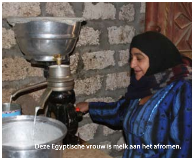
Deze Egyptische vrouw is melk aan het afromen.

Egypte wordt door woestijngebied gekenmerkt. Het merendeel van de Egyptenaren woont in de vruchtbare omgeving van de Nijl, waar ook de meeste bedrijvigheid plaatsvindt. Dorcas is in het land betrokken via vijftien projecten. In het gouvernement El Minya creëert Dorcas-partner EL Nahda for Relief and Development arbeid en inkomen met en voor de lokale bevolking.