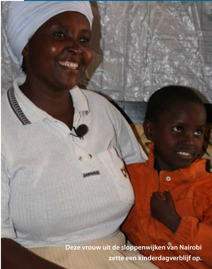
Deze vrouw uit de sloppenwijken van Nairobi zette een kinderdagverblijf op.

In maart dit jaar ging ik voor de tiende keer met een groep ondernemers op reis naar Kenia. De reis was georganiseerd door Dorcas Ondernemers (DO) Regio West, voorheen Dorcas Ondernemers Duin- en Bollenstreek. Zeven ondernemers en twee medewerkers van een tv-productiebedrijf die een film maken over de ondernemersgroep, gingen mee.